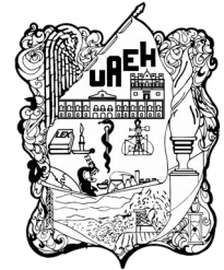
Universidad Autónoma del Estado de Hidalgo