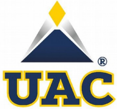
Universidad Autónoma de Campeche