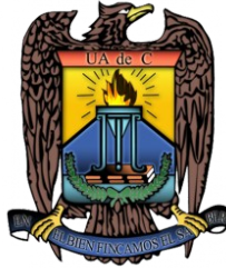
Universidad Autónoma de Coahuila