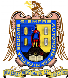
Universidad Autónoma de San Luis Potosí