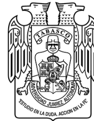
Universidad Juárez Autónoma de Tabasco