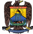
Universidad Autónoma de Coahuila