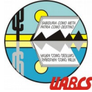
Universidad Autónoma de Baja California Sur